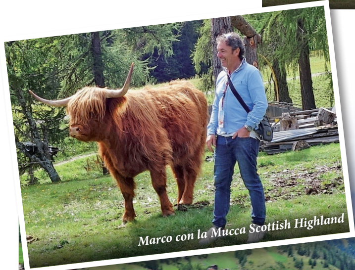
Marco con la Mucca Scottish Highland