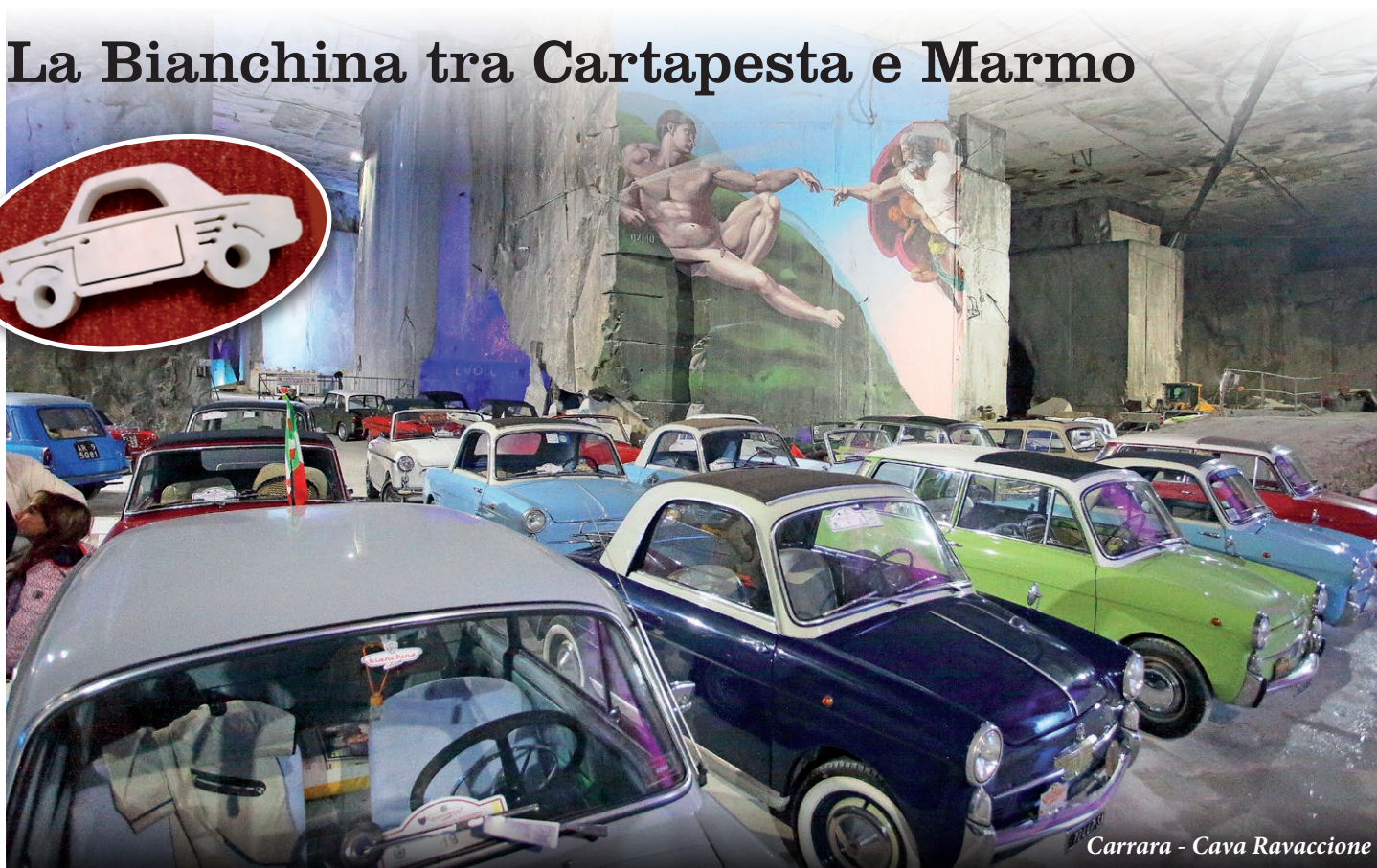
Carrara - Cava Ravaccione

Ultimo riuscitissimo raduno per il Bianchina Club, a chiusura di un'intensa stagione che ha visto le Bianchina a Modena, a Senigallia, a Cuneo, sulle Dolomiti ed infine appunto in Versilia dal 23 al 25 di settembre.