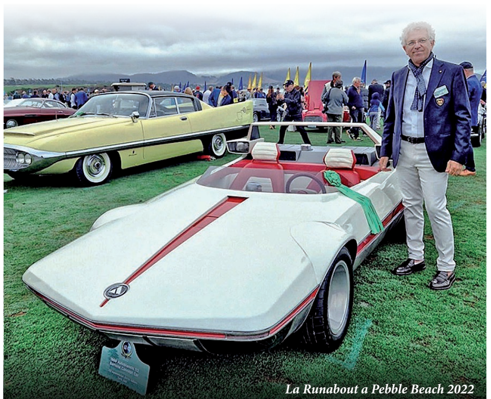
La Runabout a Pebble Beach 2022