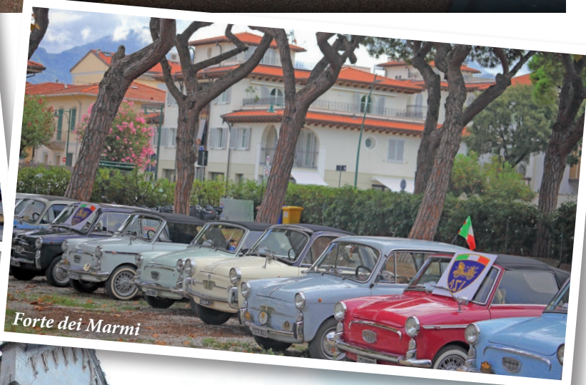
Forte dei Marmi