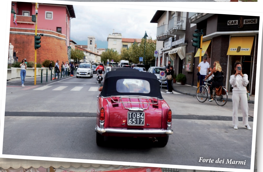
Forte dei Marmi