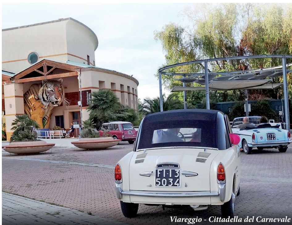
Viareggio - Cittadella del Carnevale

Più di trenta auto, provenienti da tutta l'Italia, si sono ritrovate per iniziare il venerdì il raduno scoprendo Viareggio, con la visita guidata alla Cittadella del Carnevale, inaugurata nel 2001, che ospita il Museo, in cui vengono raccontati i quasi 150 anni di storia del Carnevale di Viareggio, e gli hangar dove ogni anno sono costruiti gli incredibili enormi carri, opere di veri artisti del settore. Il sabato le auto sono partite per Carrara, dove, attraversando i tunnel della "Marmifera", che era un treno adibito al trasporto dei blocchi, sono giunte alla Cava Galleria Ravaccione n.84 e sono state eccezionalmente ospitate al suo interno. Le stanze della "Cattedrale del marmo", sono lo spettacolare frutto della tecnica di escavazione interna, e le Bianchina sono state parcheggiate sotto il grande murale di Ozmo, omaggio a Michelangelo, che prediligeva il marmo di Ravaccione per le sue opere, mentre i partecipanti