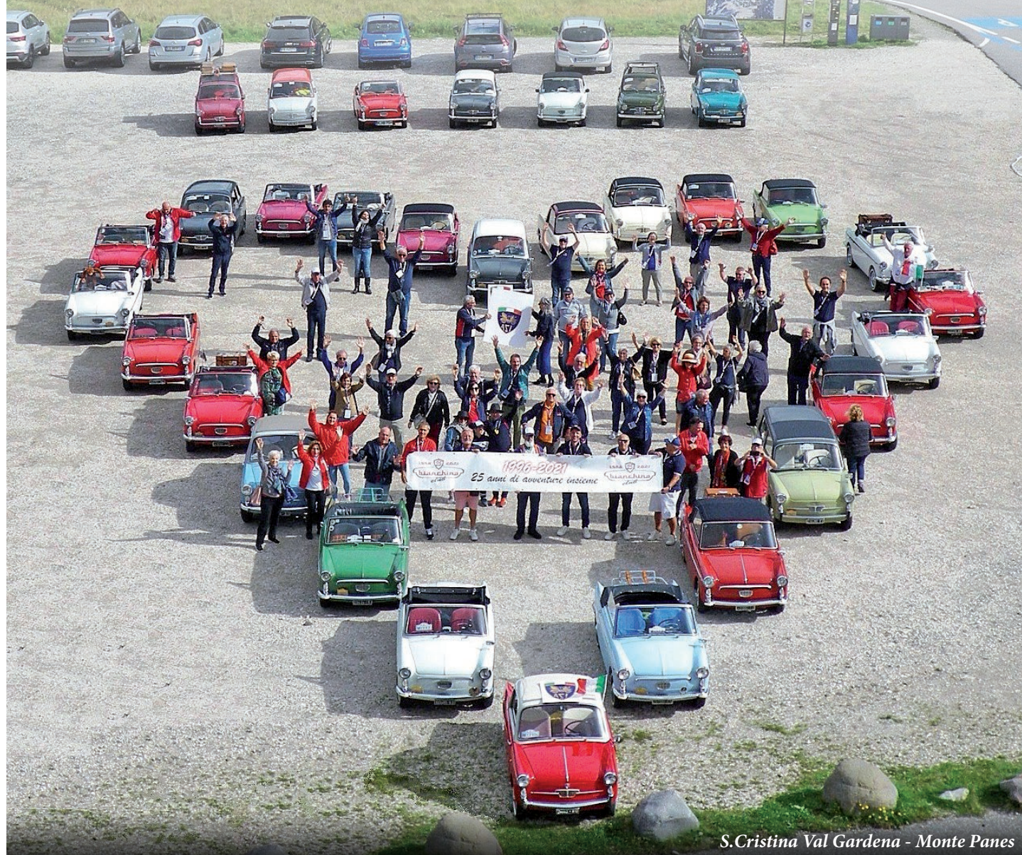
S. Cristina Val Gardena - Monte Panes

Scoprire le Dolomiti in Bianchina è stata un'esperienza entusiasmante!