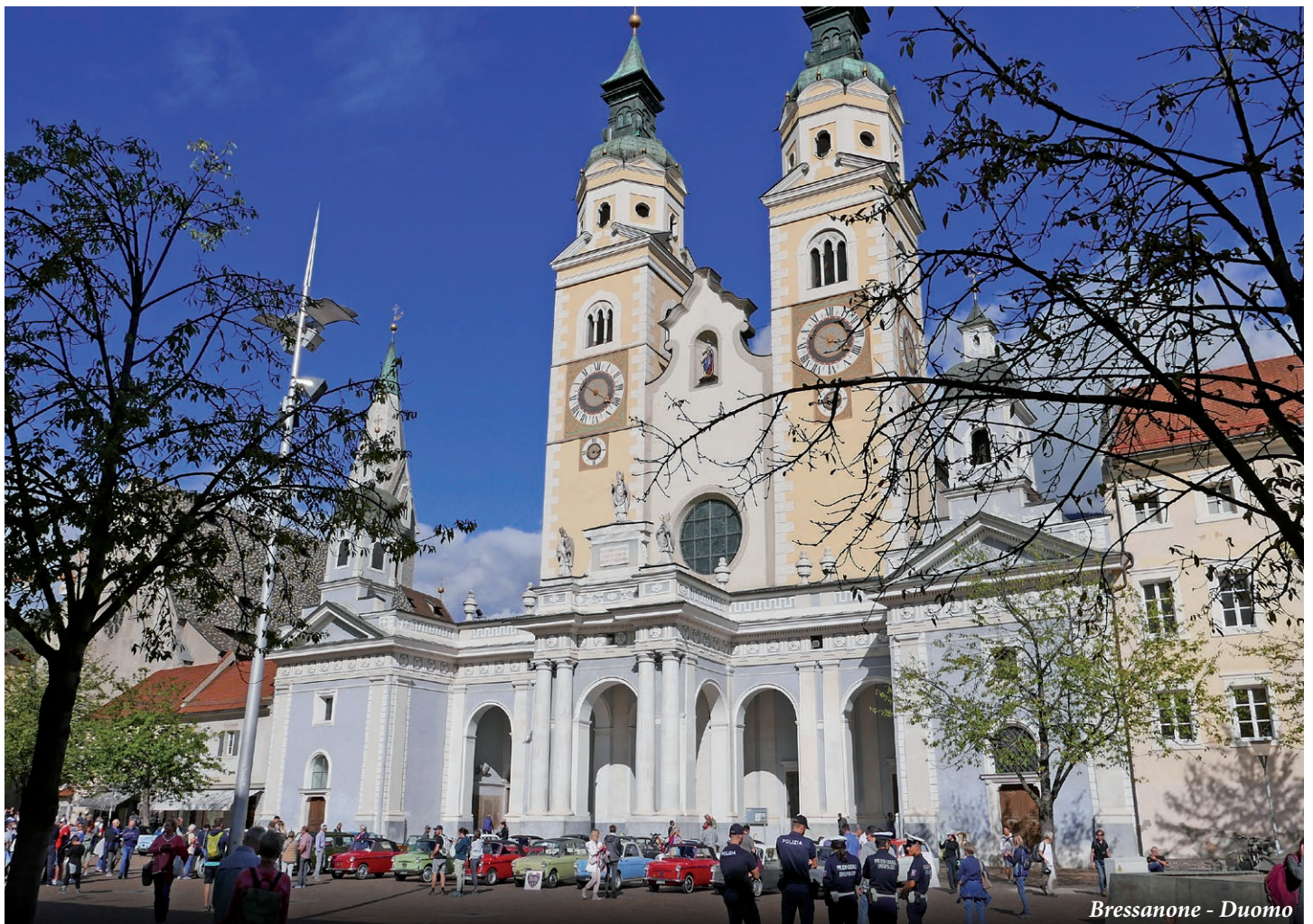
Bressanone - Duomo

ca, le Bianchina si sono arrampicate fino a 2000 metri, al passo delle Erbe, in una bella giornata di sole. Tutti i partecipanti hanno ricevuto omaggi di prodotti locali, mele Marlene, biscotti Loacker, birra Forst e dell'ottimo speck, e tanti divertenti e spiritosi premi a conclusione della manifesta-