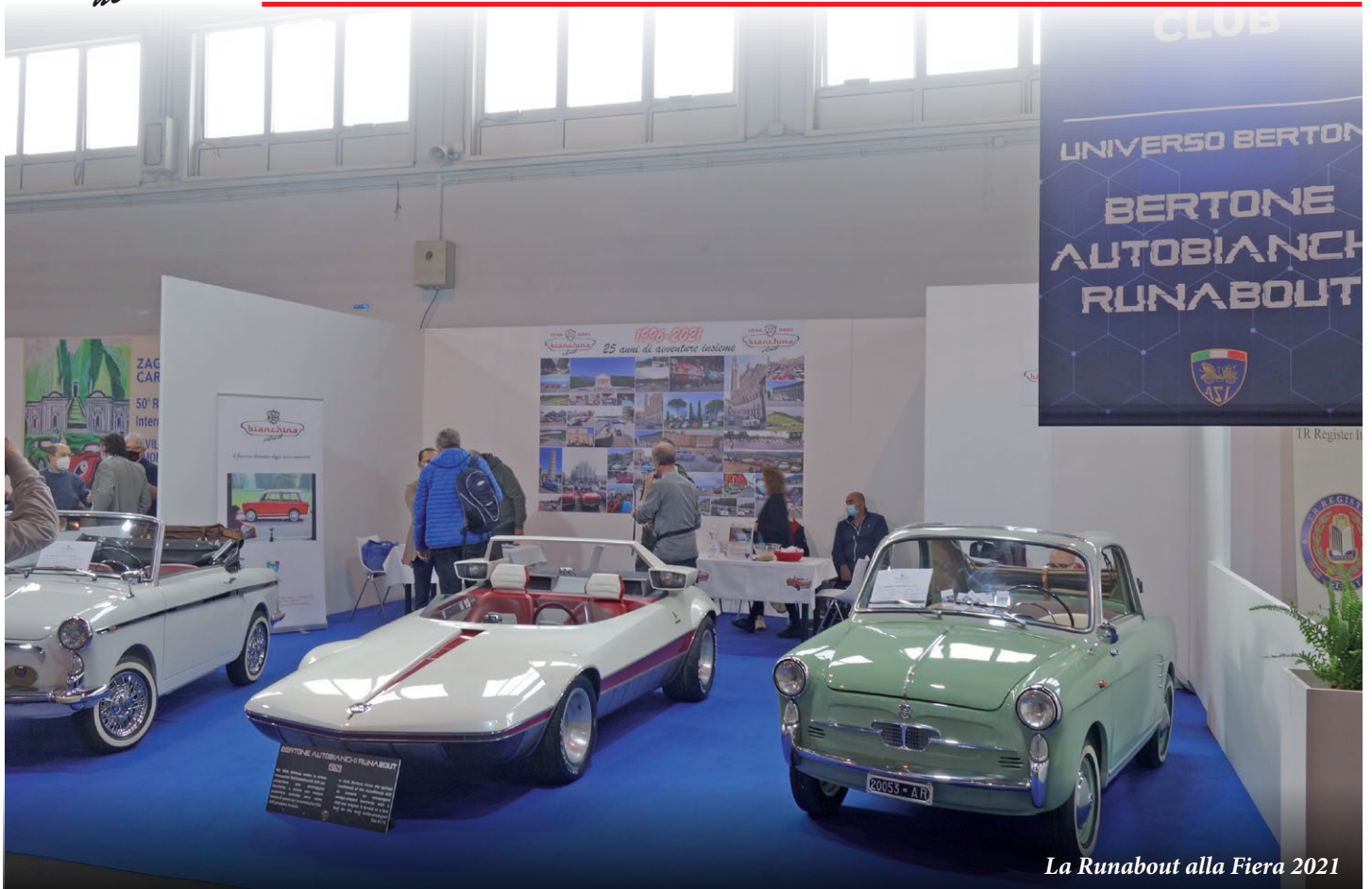
La Runabout alla Fiera 2021