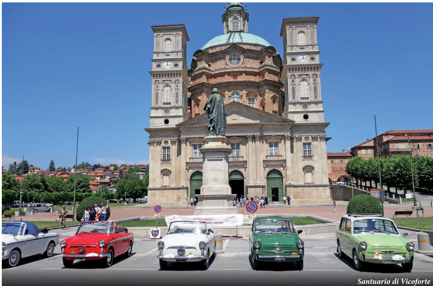
Santuario di Vicoforte