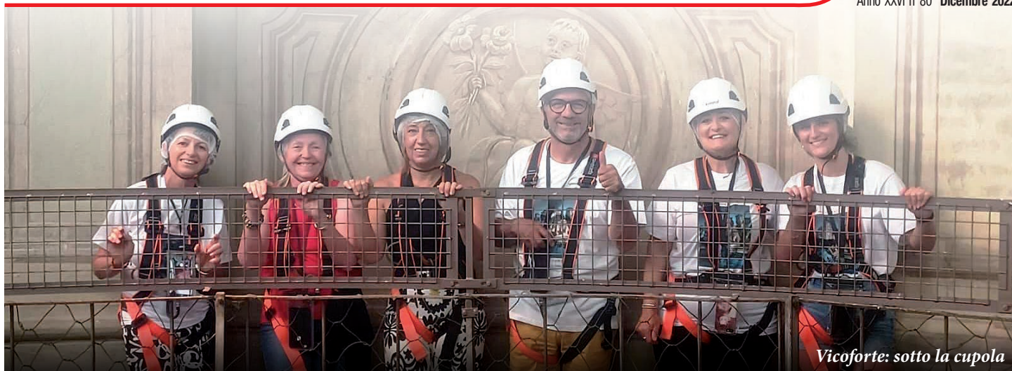
Vicoforte: sotto la cupola