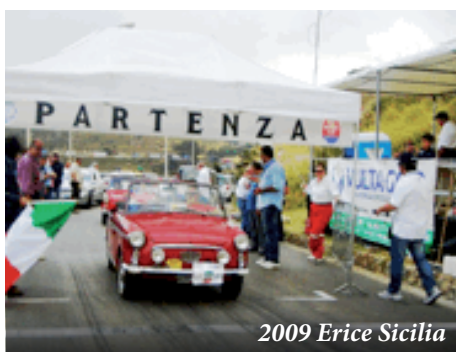
2009 Erice Sicilia