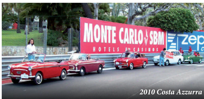
2010 Costa Azzurra