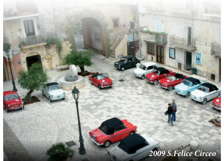
2009 S.Felice Circeo