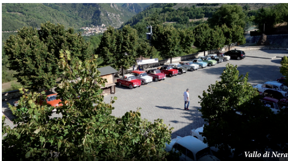
Vallo di Nera