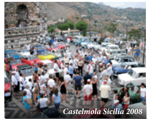
Castelmola Sicilia 2008