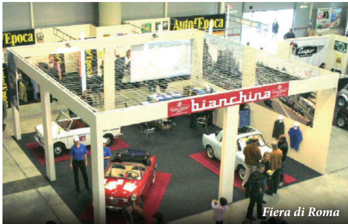
Fiera di Roma