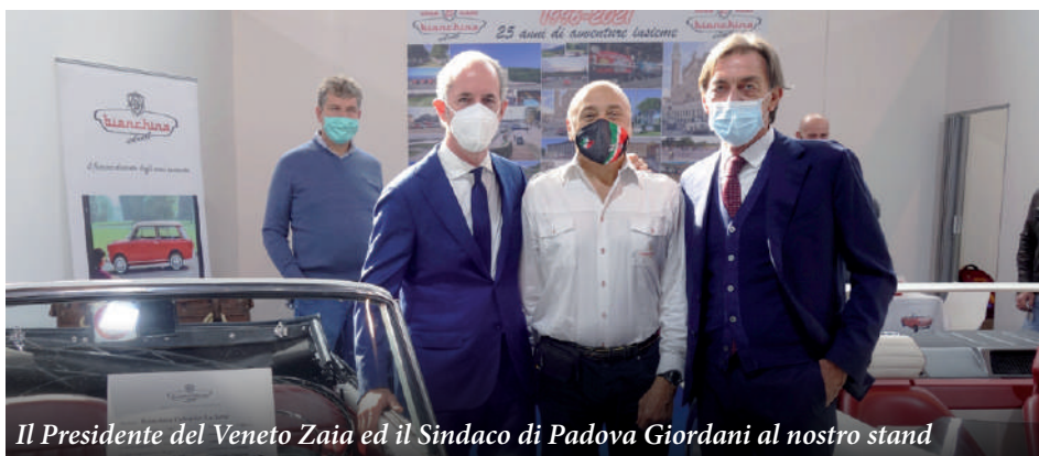
Il Presidente del Veneto Zaia ed il Sindaco di Padova Giordani al nostro stand

€ 100 con associazione ASI e mensile La Manovella - € 70,00 senza ASI - Soci esteri € 50,00. Aggiungendo 20 € si avrà anche l'abbonamento al quindicinale Epocauto.