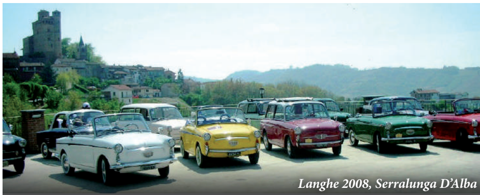
Langhe 2008, Serralunga D'Alba