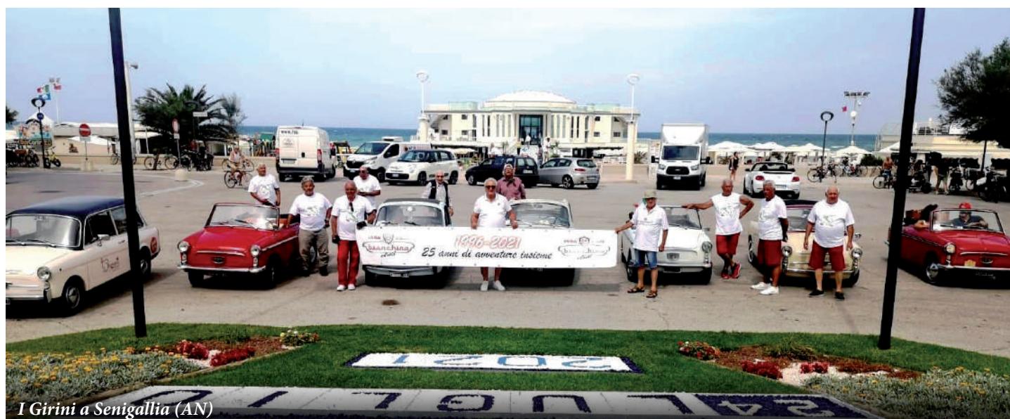
I Girini a Senigallia (AN)