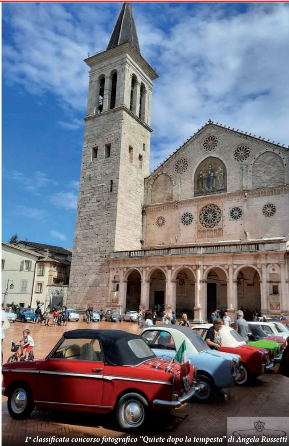
1 a classificata concorso fotografico "Quiete dopo la tempesta" di Angela Rossetti

Presso l' Hotel Il Baio Relais & Natural Spa , è stata consegnata a tutti i partecipanti una borsa personalizzata col manifesto del raduno, contenente gadget e pubblicazioni e una ricca cassetta di omaggi alimentari offerti dalla ditta Pietro Coricelli . E' stato consegnato anche un bel libretto illustrato che presentava gli itinerari e la descrizione delle località visitate. Alle 17.00 il raduno è partito per Campello sul Clitumno, dove si è svolta la visita guidata del Parco delle Fonti e del Tempietto del Clitumno, che dal 2011 è stato riconosciuto patrimonio dell'Unesco nell'ambito dei siti "I Longobardi in Italia". A seguire visita all'antico " Frantoio Carletti " che esiste dal 1620, con spiegazione dei macchinari e della tecnica per la produzione dell'olio e degustazione di bruschette. Ancora a Campello sul Clitumno, cena presso il ristorante " Trattoliva " con un ricco menù legato alla tradizione locale a cui sono stati abbinati tre ottimi vini, illustrati, prima di ogni portata, dal loro produttore titolare della Cantina Colle Uncinano . Sabato 4 settembre, alle 9.00, partenza dall'hotel Il Baio, con scorta dei vigili urbani, per giungere nella Piazza Duomo di Spoleto, dove le Bianchina sono state parcheggiate, accolte dal Comandante dei Vigi-