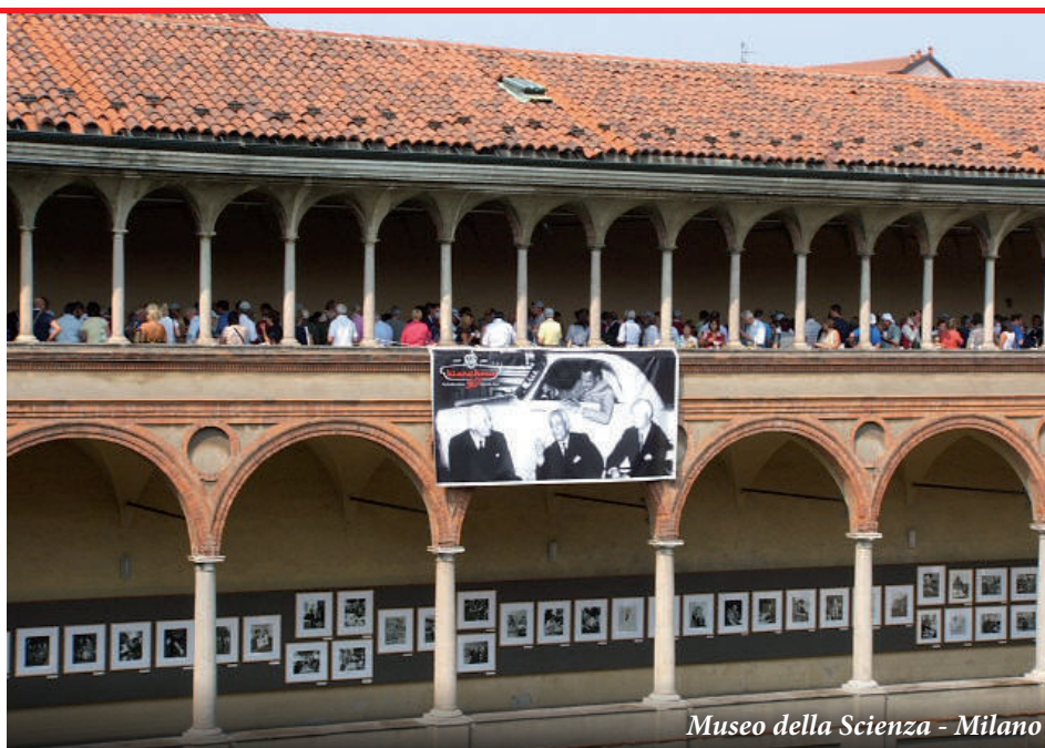
Museo della Scienza - Milano