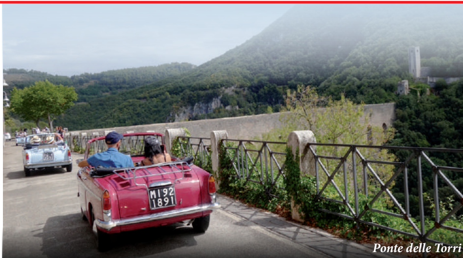
Ponte delle Torri