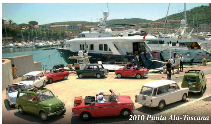
2010 Punta Ala-Toscana