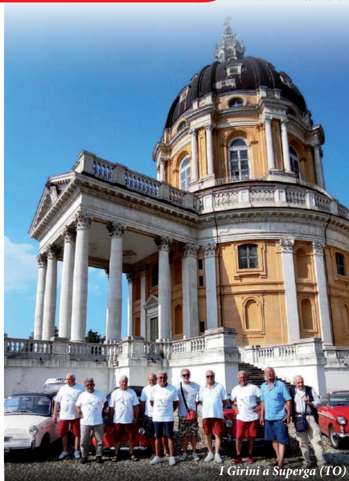
I Girini a Superga (TO)

Le auto che hanno percorso tutti i 3.259 km (ben più di quelli preventivati sulla carta) sono cinque cabriolet, due trasformabili, una panoramica ed una giardiniera. Le piccole Autobianchi, cariche di anni (da 50 a 60) e chilometri non hanno praticamente registrato guasti ed inconvenienti, solo 4 forature e 2 condensatori sostituiti. Questo dimostra la robustezza delle vetture e la validità del progetto della meccanica dovuto al grande Dante Giacosa. Il giro, anche gastronomico, d'Italia è stato ben digerito dagli equipaggi, dal fritto piemontese ai frutti di mare pugliesi, passando per la bistecca fiorentina e la piadina romagnola, e sono state superate senza danno anche le alte temperature di quei giorni, arrivate, in Puglia, fino a 42 gradi! I "girini" della Bianchina hanno avuto festosa accoglienza da tutti i soci delle zone toccate, numerosi dei quali hanno accompagnato il gruppo per molti chilometri, allungando quindi il corteo delle Bianchina. Il Giro, partendo dal Lazio è transitato per Toscana, Liguria, Piemonte, Lombardia, Emilia-Romagna, Marche, Abruzzo, Molise, Puglia, Basilicata e Campania, prima di