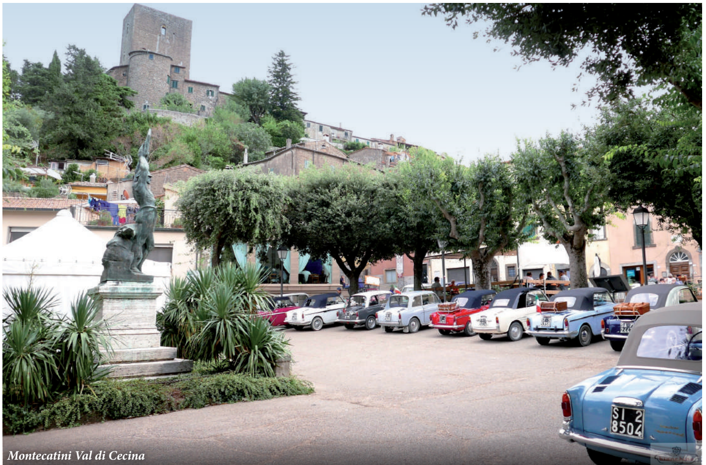
Montecatini Val di Cecina