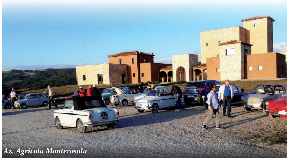
Az. Agricola Monterosola

è un superlativo impianto di produzione vinicola. La “Tenuta Monte Rosola” con i suoi futuristici tini di fermentazione in cemento alti 10 metri fa dimenticare il vecchio romanticismo del vino del contadino. Altri punti di interesse sono stati il museo minerario di Montecatini Val di Cecina ed ovviamente la visita guidata della città di Volterra. Si sono visitati il duecentesco Palazzo dei Priori, tutto-ora Municipio, la Pinacoteca e Museo Civico ed il Museo dell'alabastro che reso famosa Volterra per la sua lavorazione. In una bottega artigianale si è potuta vedere dal vivo l'abile lavorazione di questo particolare gesso. Tra tutte le tappe del programma c'erano sempre pochi chilometri di strada attraverso dolci colline che regalavano viste quasi infinite. I campi, dopo il raccolto erano tutti arati. Verso sera