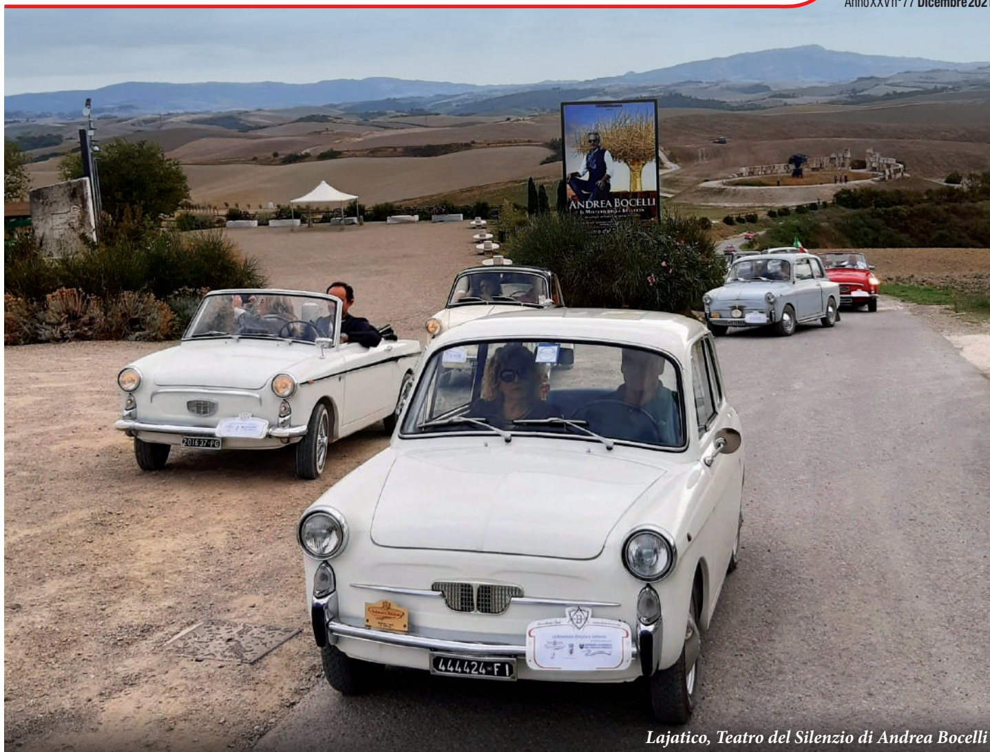
Lajatico, Teatro del Silenzio di Andrea Bocelli