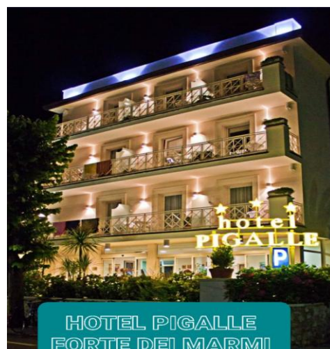
HOTEL PIGALLE FORTE DEI MARMI